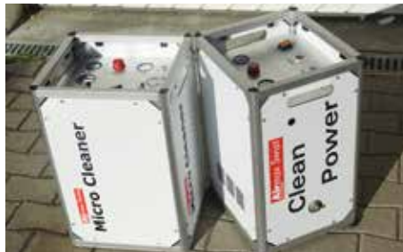
Das «Microclean»- System reinigt effizient Bodenheizungsrohre.

Wie funktioniert das «Microclean»-System? Das Gerät entwickelt eine Art Schallwellen. Am ehesten ist die Wirkung mit Ultraschall zu vergleichen. Um die Partikel und den Schlamm auszuspülen, wird Wasser benötigt, dessen Druck aber nicht grösser ist als derjenige einer Giesskanne. Somit ist eine gründliche und sanfte Reinigung der Heizungsrohre gewährleistet.