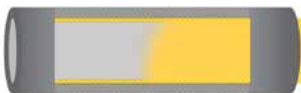
Um den Alterungsprozess der Heizungsrohre zu stoppen und bereits vorhandene Haarrisse...