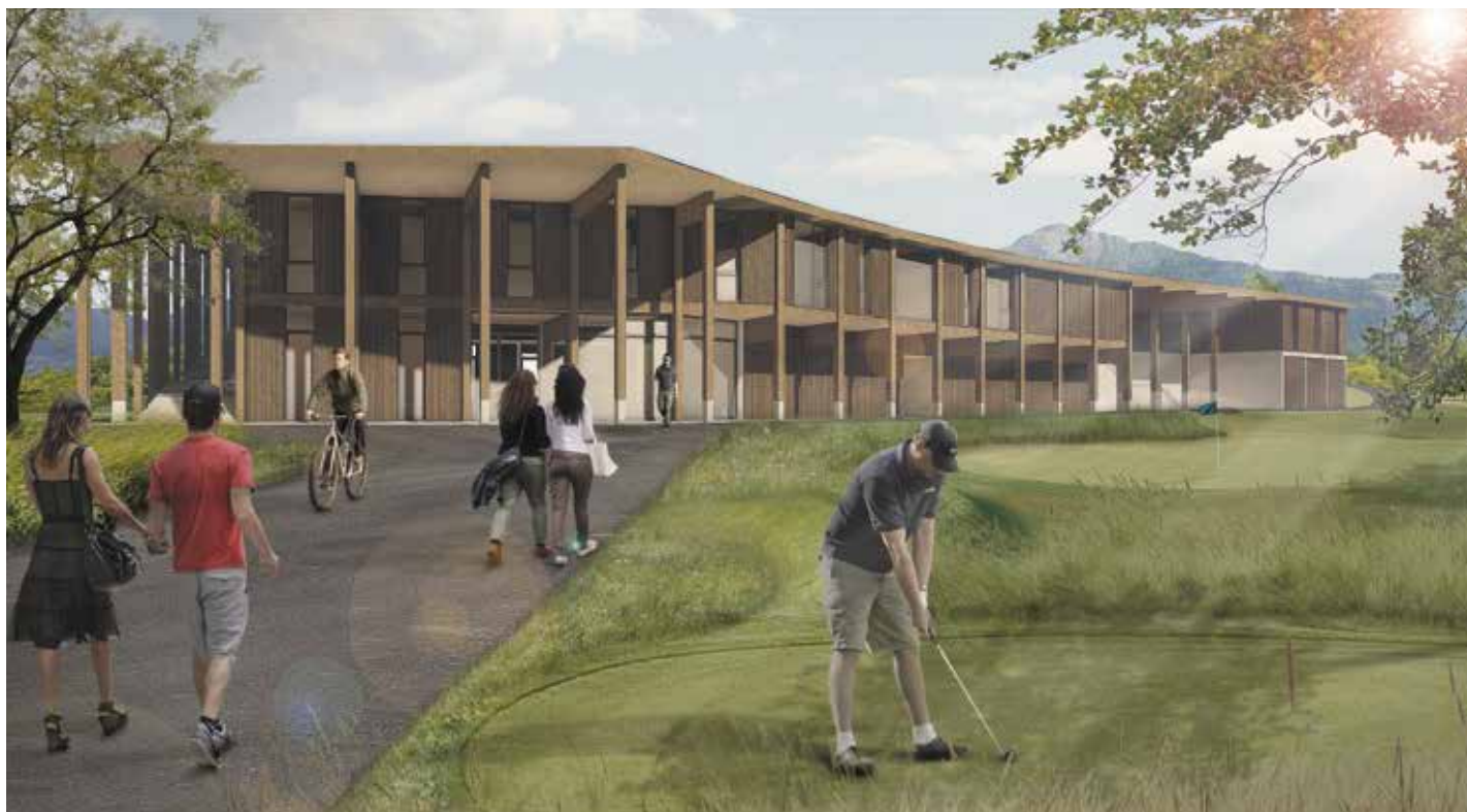
Ab diesem Spätsommer in Betrieb: die neue Golf-Academy im erweiterten und renovierten Migros-Golfpark Holzhausen ZG.

Die stets anforderungsreicheren und komplexer werdenden Bauprojekte mit den vielen Spezialisten und den umfangreichen Vorschriften machen sogenannte Bauherrenberater als Begleiter des Bauherren vielfach notwendig.