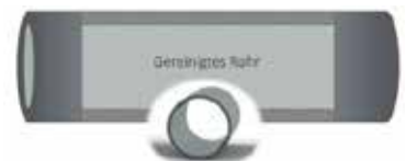
Dank der Systemspülung spart man Energiekosten und erreicht eine mollige Wärme in allen Räumen.