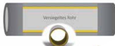
... zu schliessen, werden die Heizungsrohre durch ein Versiegelungsverfahren von innen versiegelt.