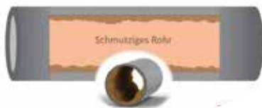
Nach langjährigem Betrieb lagern sich Schlamm und sonstige Schmutzpartikel in den Rohren ab.

Weitere Informationen Airmax Swiss Heizsystemreinigung & Engergietechnik Pünten 4, 8602 Wangen, Tel. 0848 848 828 info@airmaxswiss.ch , www.airmaxswiss.ch Schweizweit 10 Filialen