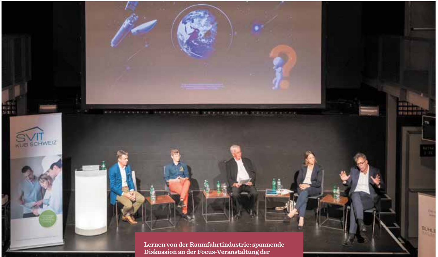
Lernen von der Raumfahrtindustrie: spannende Diskussion an der Focus-Veranstaltung der Kammer Unabhängiger Bauherrenberater im Club Härtereie in Zürich.

In der Raumfahrtindustrie haben sich kooperative Zusammenarbeitsmodelle bewährt. Davon könnte sich auch die Bauwirtschaft eine Scheibe abschneiden. Das zeigte die Diskussion an der Focus-Veranstaltung der Kammer Unabhängiger Bauherrenberater KUB. TEXT – RETO WESTERMANN*